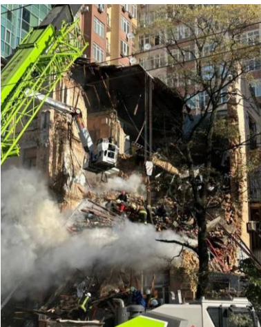
Kamikaze drone attack in Kyiv