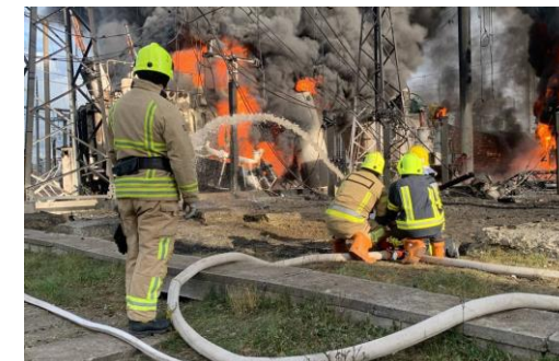
Consequences of attack on power infrastructure in Rivne (left) and Zhytomyr (right)