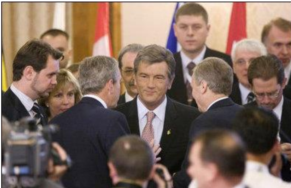
El Presidente de Ucrania, Viktor Yushchenko, conversa con el Presidente de Estados Unidos, George W. Bush, en la conferencia de la Cumbre de la OTAN en Bucarest, donde se tomó una de las decisiones más controvertidas de la Alianza. Jueves, 3 de abril de 2008.

Tras su independencia en 1991, Ucrania siguió inicialmente una política exterior no alineada, lo que significaba que no se unía a ninguna alianza militar. Ucrania empezó a cooperar con la OTAN en 1994, pero no fue hasta 2002 cuando declaró oficialmente su deseo de unirse a la alianza.