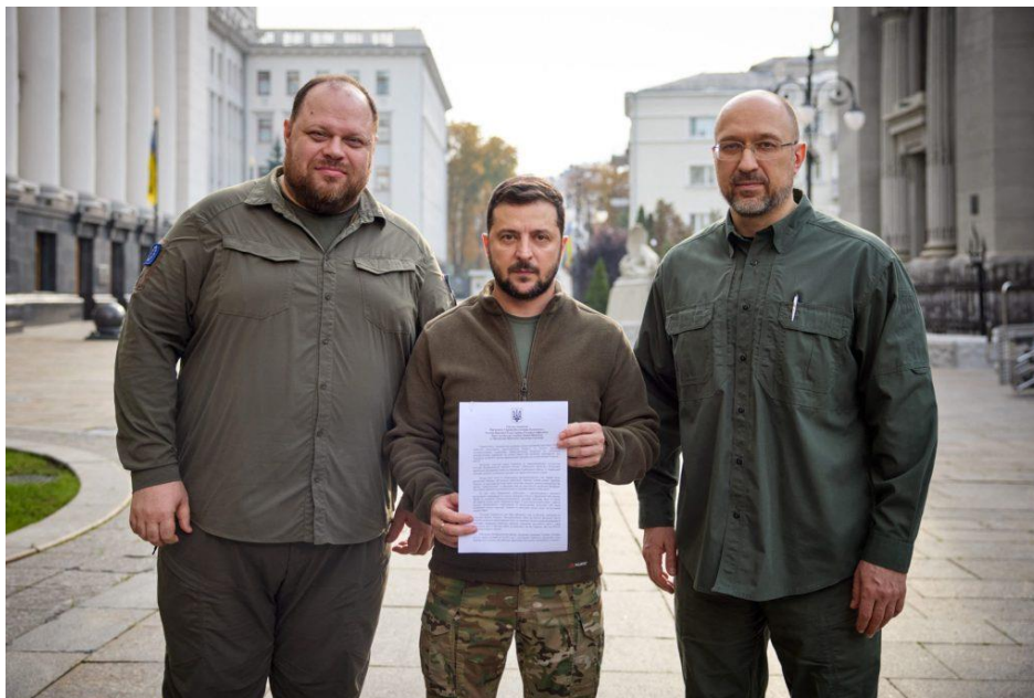
El 30 de septiembre de 2022, el Presidente Volodymyr Zelenskyi anunció por sorpresa su intención de adherirse por la vía rápida a la alianza militar OTAN.

De hecho, el éxito de la defensa ucraniana frente a la ofensiva rusa la convirtió en un aliado más prometedor para la OTAN. Ahora Ucrania tiene uno de los ejércitos más numerosos de Europa, curtido en la batalla y entrenado para utilizar armamento occidental moderno en combate real. Además, las operaciones de las unidades ucranianas, que se han ejecutado contra un enemigo mucho más numeroso, se están estudiando ahora para una respuesta más eficaz y rápida de la organización ante posibles amenazas contra la seguridad. Así pues, la posible adhesión de Ucrania reforzará significativamente el potencial militar de la Alianza.