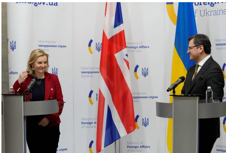
La ministra británica de Asuntos Exteriores, Liz Truss, y el ministro ucraniano de Relaciones Exteriores, Dmytro Kuleba, asisten a una rueda de prensa conjunta tras sus conversaciones en Kyiv, el 17 de febrero de 2022.

La cooperación se centró inicialmente en la coordinación del apoyo a la Plataforma de Crimea, la cooperación en materia de seguridad cibernética y energética y el refuerzo de las comunicaciones estratégicas. La cooperación e interacción militar podrían ser áreas de cooperación dentro de la alianza, pero es demasiado pronto para decir si éstas serán las principales áreas de cooperación. Esto se debe a que el Reino Unido proporciona ayuda a Ucrania directamente, y no en el contexto de una alianza.