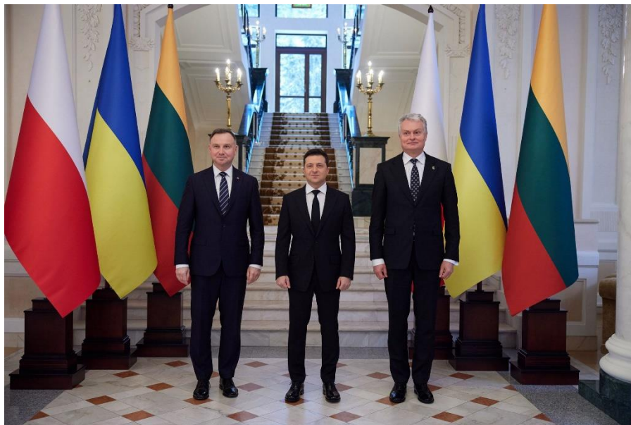
Gitanas Nausėda de Lituania han firmado la Declaración del Triángulo de Lublin en apoyo de la adhesión de Ucrania a la Unión Europea y la OTAN.

La dimensión de la seguridad es muy importante en la agenda del Triángulo de Lublin. Debido a su proximidad a Rusia y a su experiencia histórica, Polonia, Lituania y Ucrania comparten una percepción similar de las amenazas militares y políticas "tradicionales", así como de un nuevo tipo de amenaza en forma de desinformación. Rusia se considera la principal fuente de tales amenazas entre estos países. En este contexto, la iniciativa debería servir de foro vital para la cooperación regional con el fin de mantener la estabilidad regional frente a la política agresiva de Rusia. Esto redundaría en beneficio de todos, sobre todo teniendo en cuenta que Ucrania, al expresar claramente sus aspiraciones de ingreso en la OTAN, cuenta para ello con el apoyo de sus vecinos (miembros de la Alianza).