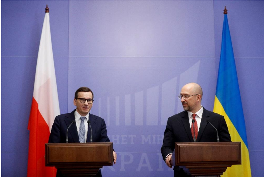
El primer ministro polaco Mateusz Morawiecki y el primer ministro ucraniano Denys Shmygal asisten a una rueda de prensa tras sus conversaciones en Kyiv, Ucrania, el 1 de febrero de 2022.

Al participar en la iniciativa de cooperación trilateral, el Reino Unido persigue una política de "Gran Bretaña global" e intenta desempeñar un papel activo en el mundo fuera de la Unión Europea. El concepto de "Gran Bretaña global" apareció por primera vez en el documento político "Gran Bretaña global en una era competitiva", un año después de la retirada del Reino Unido de la Unión Europea. En el mismo documento se identifica a Rusia como la principal amenaza para la OTAN y el Reino Unido, al tiempo que se hace hincapié en el apoyo a la integridad territorial de Ucrania y en la voluntad de ayudar al desarrollo de las fuerzas armadas ucranianas. Debido al hecho de que no todos los países de la OTAN están preparados para contrarrestar de forma decisiva la amenaza rusa, Gran Bretaña sigue utilizando tácticas de pequeña alianza para trabajar con mayor eficacia en Europa del Este.